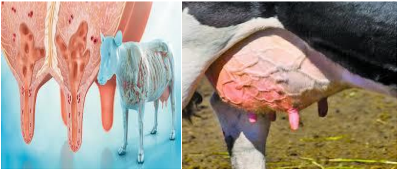
Muuqaalada nuuf lo'ah oo qaba cudurkaan galaha