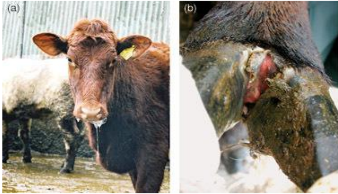
Waa muuka neef lo' ah oo qaba cudurkaan cabeebka